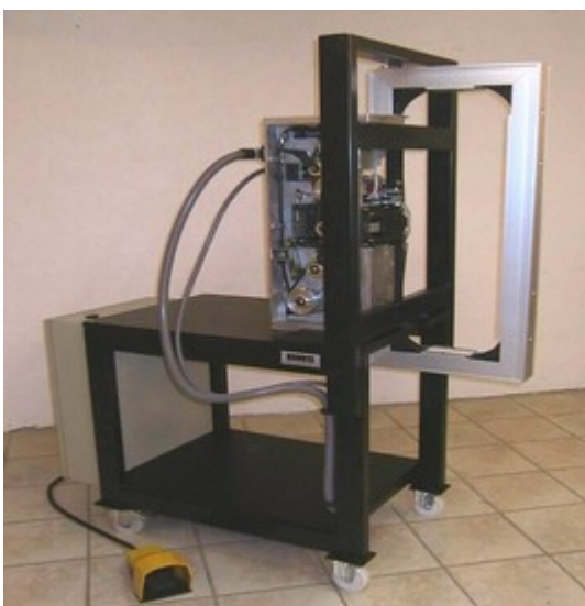
Teststand für OMS Umreifungsköpfe