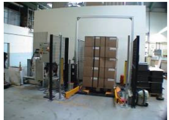
4 fach Palettenumreifung über Drehtisch