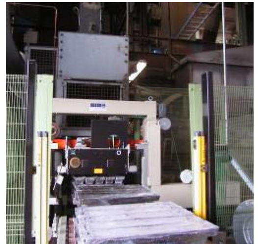
Kokillenumreifung / Fliesenpakete

Service, technische Betreuung und Ersatzteildienst mit eigenen Technikern durch OMS Verpackungssysteme Gevelsberg