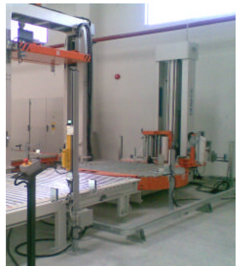
Integriert in Verpackungslinien